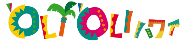
オリオリプラザ シェラトン店

Copyright ©JTБ Hawaii Travel, LLC. All rights reserved. 転載・転用・二次使用はお断りいたします。